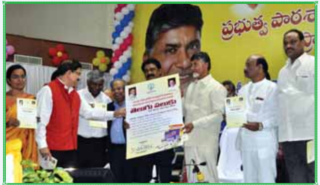
విశాఖపట్టణంలో ఆంధ్రప్రదేశ్ ప్రభుత్వం-పాఠశాల భాగస్వామ్యంతో 'తెలుగు పలుకు' కోర్సును ప్రారంభిస్తున్న ముఖ్యమంత్రి శ్రీ చంద్రబాబు నాయుడు